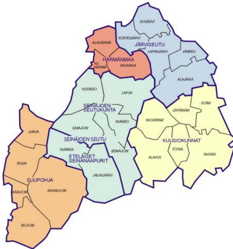
Kuva 2. Etelä-Pohjanmaan maakunta vuonna 2007